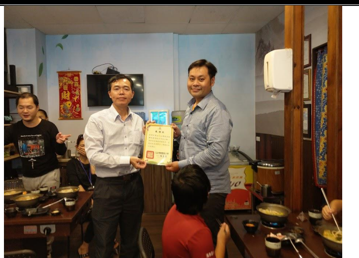
說明：感謝社團法人台灣慈善會捐贈