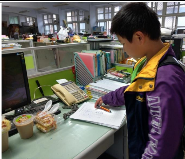
說明：開心的拿早餐，準備食用