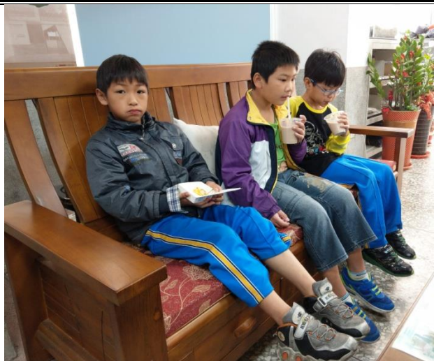
說明：學生快樂的享用愛心早餐