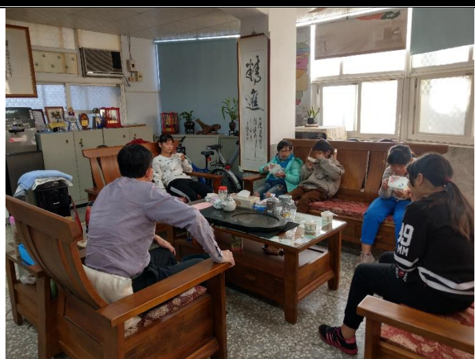
說明：校長關心愛心早餐學生