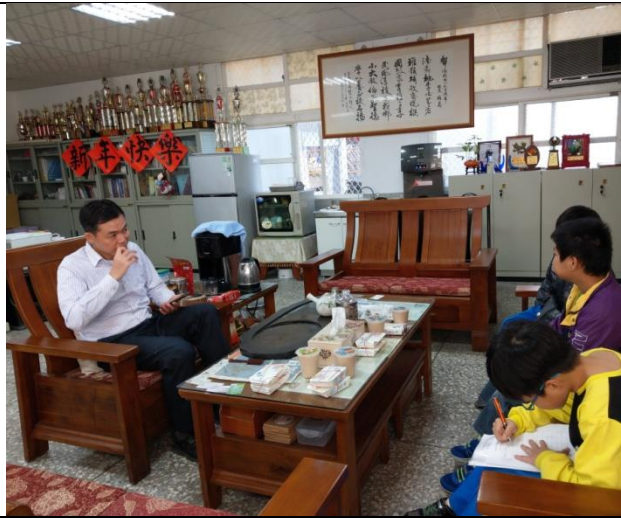
說明：校長關心愛心早餐學生