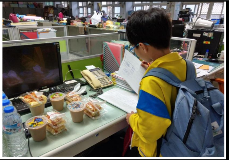
說明：學生領用愛心早餐