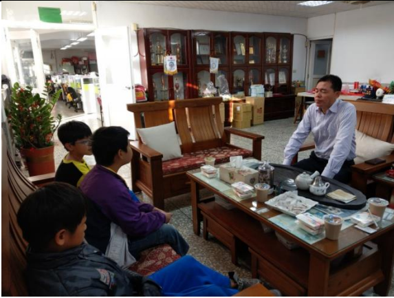
說明：校長關心愛心早餐學生