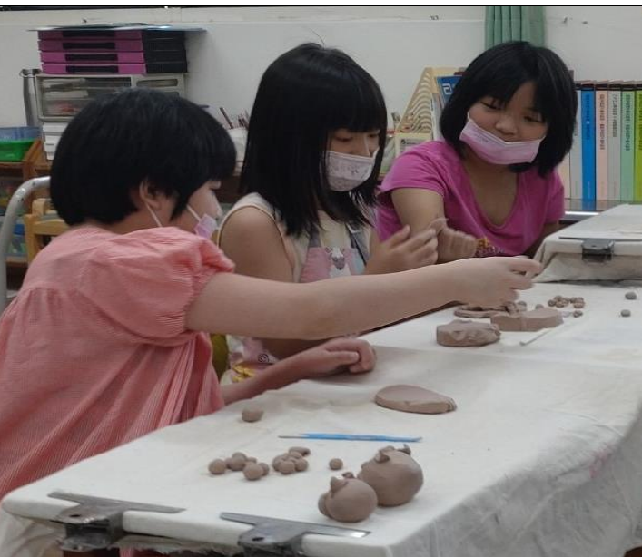
上年長一些的學生技巧較純熟，操作較能獨進行。