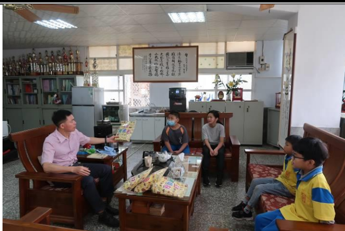
說明：開心的拿早餐，準備食用