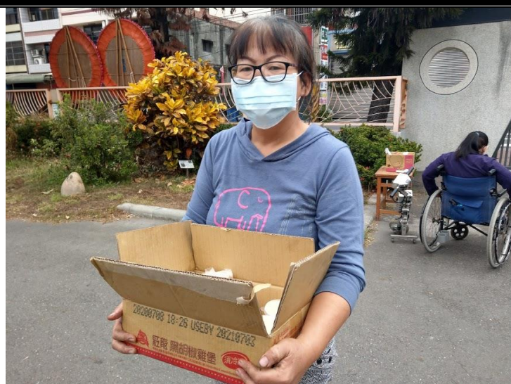
說明：愛心早餐由專人送達