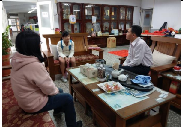
說明：校長關心愛心早餐學生