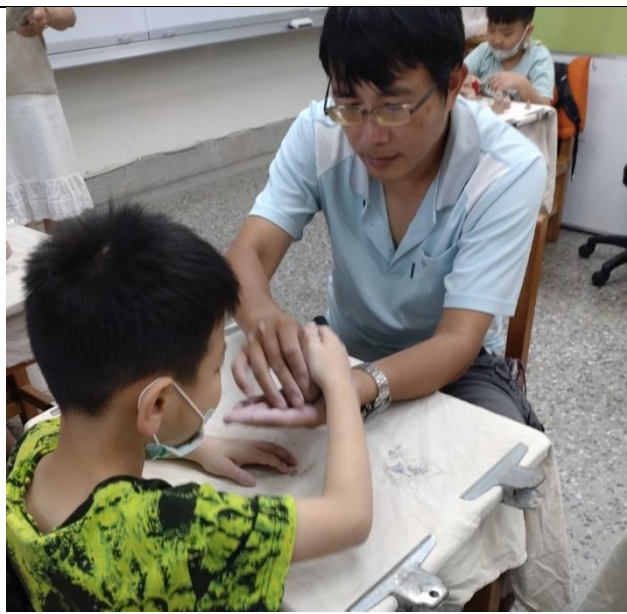
老師用心引導學生動手做，培養基本能力。