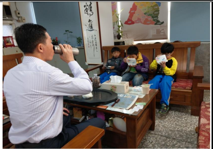
說明：學生快樂的享用愛心早餐

「社團法人台灣慈善會」長期資助弱勢學童愛心早餐，孩子們有營養充足的愛心早餐的提供，精神更專注，學習力及人際關係都變得更好。