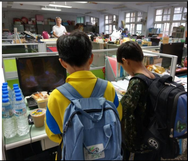
說明：學生領用愛心早餐。