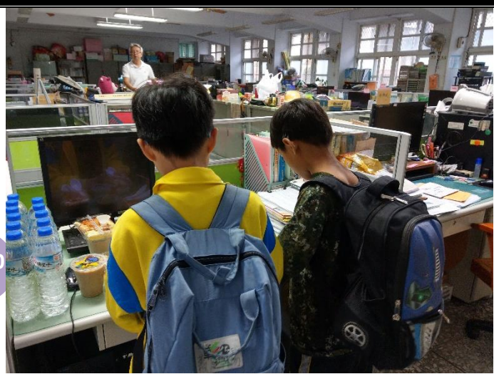
說明：學生領用愛心早餐

個案中有有一對姊弟，其單親媽媽罹患罕病「多發性硬化症」，肌肉萎縮無力的狀況日益嚴重，經常進出醫院，無法工作，亦無法給孩子良好的照顧。慈善會得知孩子們的狀況，立即核撥急難救助金三千元，更破例提供暑假期間的愛心早餐，善心之舉令人感激與感佩！